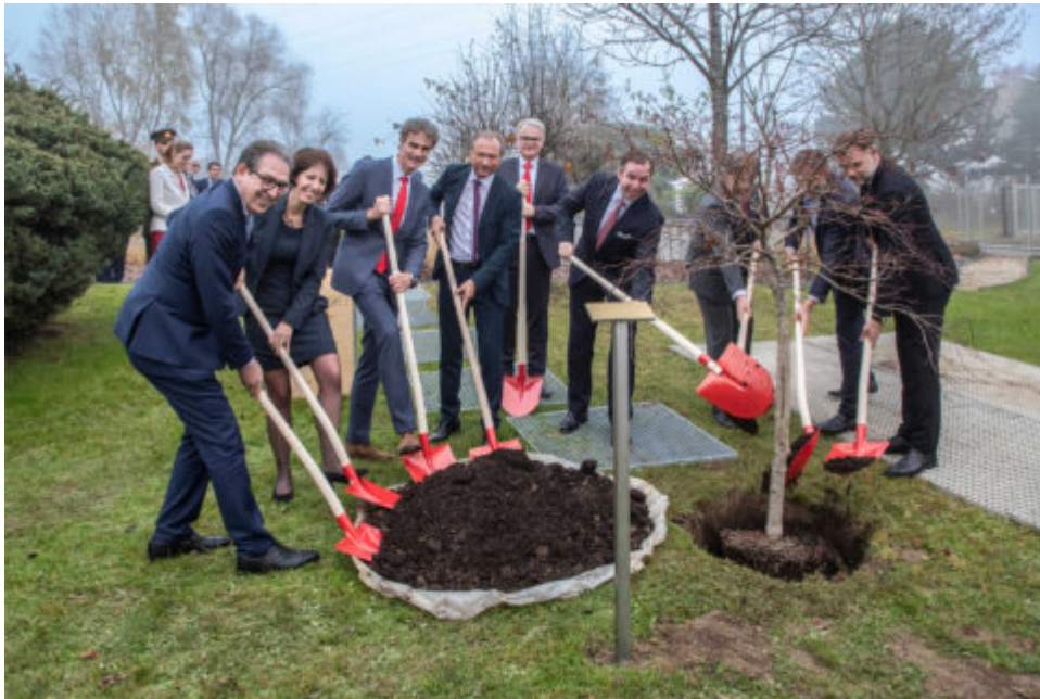
Plantation conjointe d'un érable à l'occasion du 100e anniversaire.