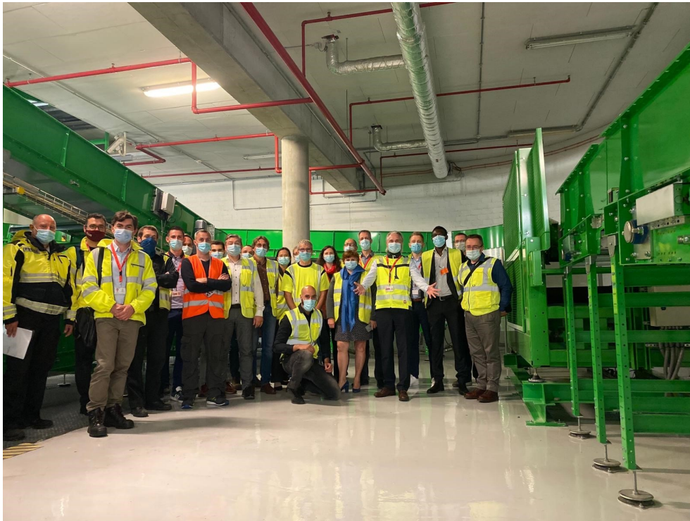
L'équipe lux-Aéroport a géré l'échange du système de traitement des bagages. En arrière-plan, vous voyez une partie de la nouvelle installation. Les personnes sur la photo : l'équipe lux-Aéroport, la Police Grand Ducale, la Direction de l'Aviation Civile.