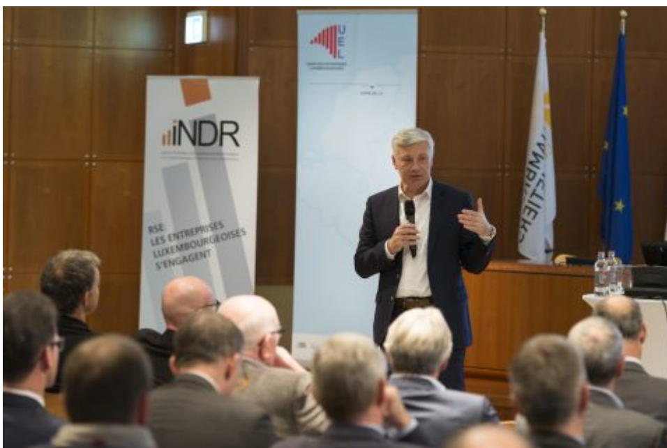
Invité de l'honneur, Claude Wiseler

Depuis quelques années, l'UEL questionne le modèle de croissance luxembourgeois et son lien avec les finances publiques et le financement des retraites. Afin de débattre de cette thématique primordiale pour le développement à moyen terme des entreprises, l'UEL a invité les représentants des Assemblées plénières et Conseils d'administration des Chambres et Fédérations patronales du Luxembourg ainsi que des chefs d'entreprise à une conférence qui a eu lieu le 23 octobre à la Chambre des Métiers.