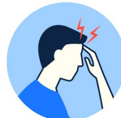
Maux de tête